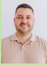
VEREADOR RODRIGO BAXO Bancada União Brasil