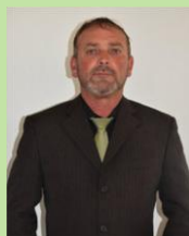
VEREADOR JERRI ADRIANI Bancada PSDB