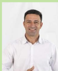
VEREADOR RAFAEL FAGUNDES Bancada PSDB