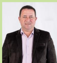
VEREADOR FLAVIO ZANONI Bancada MDB